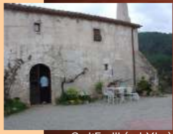
Ca l'Emili (cal Xim)