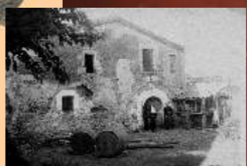
Can Sabat de la Pujada