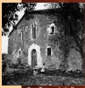
Can Terme de la Parra